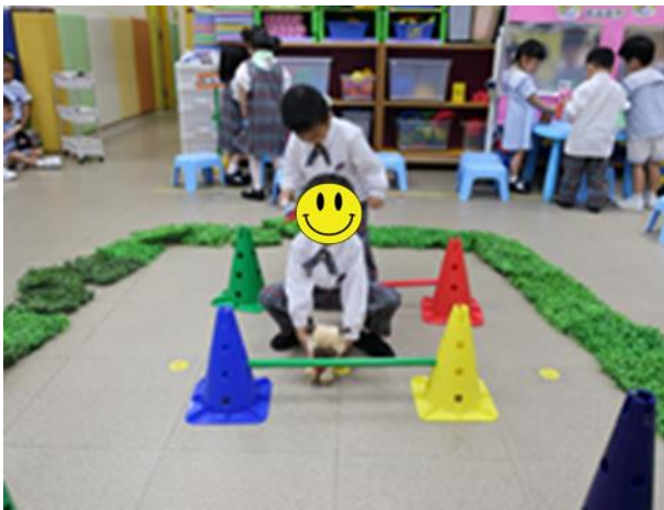
跳呀跳！大家逐一教導小狗學習跳欄。