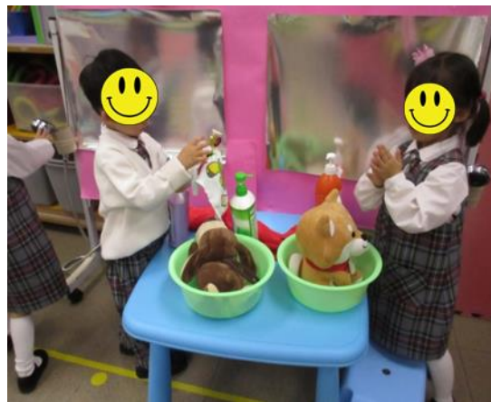
洗呀洗！小狗乖乖做個清潔好孩子。