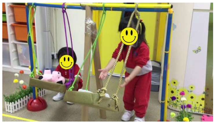
推呀推！快來坐鞦韆！