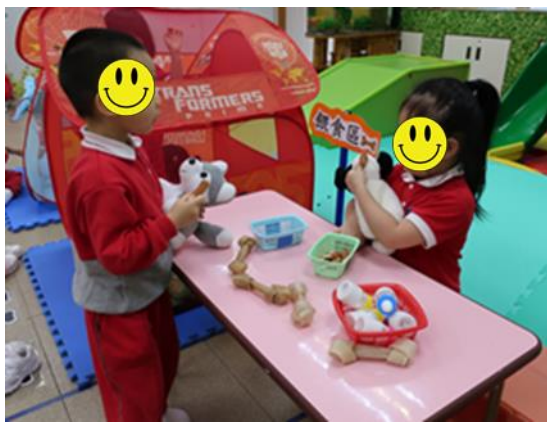
我們一起餵飼小狗吧！