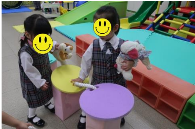
小心啊！跳樁運動真刺激。